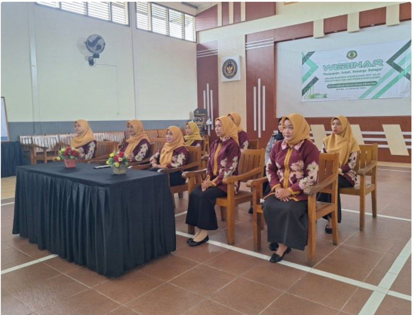
Peringati HUT ke-21, PIPAS Rutan Blora Ikuti Webinar "Perempuan Sehat, Keluarga Bahagia"

Blora – Paguyuban Ibu-Ibu Pemasarakatan (PIPAS) Rumah Tahanan Negara (Rutan) Kelas IIB Blora mengikuti webinar dalam rangka memperingati Hari Ulang Tahun (HUT) PIPAS yang ke-21. Acara tersebut berlangsung di Graha